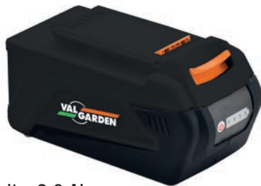
XB 420 Batteria 40 Volt - 2.0 Ah Type of cells 18650 Potenza 72 Wh max Tempo di ricarica 60 minuti circa Peso 800 grammi