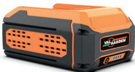
XB 640 Batteria professionale 60 Volt - 4.0 Ah Type of cells 21700 Potenza 216 Wh max Tempo di ricarica 115 minuti circa Peso 1620 grammi