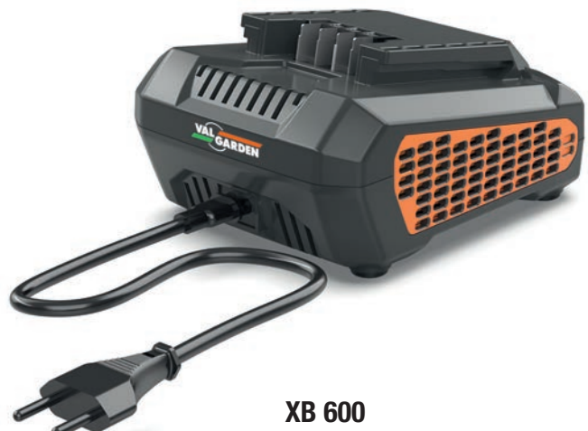
XB 600 Caricabatterie per batterie Valgarden 60 Volt Velocità standard Corrente 2.5 A