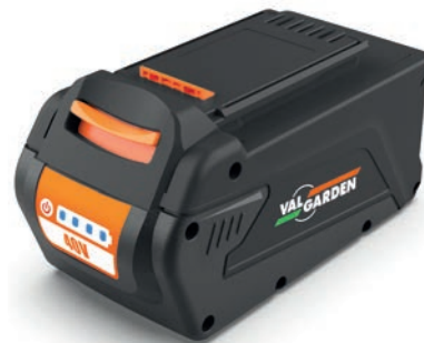
XB 440 Batteria 40 Volt - 4.0 Ah Type of cells 18650 Potenza 144 Wh max Tempo di ricarica 120 minuti circa Peso 1300 grammi