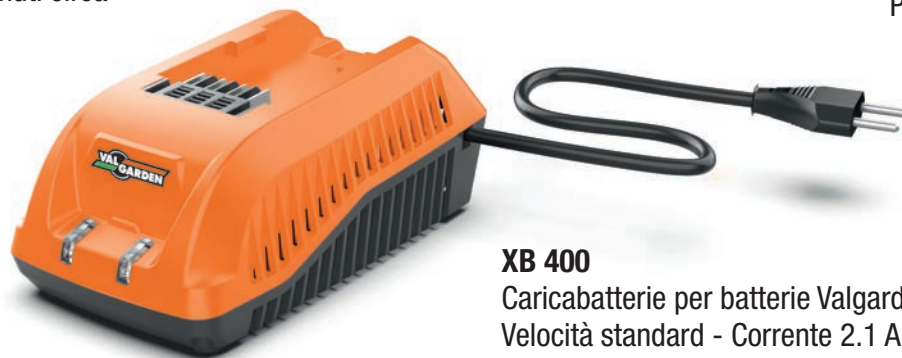
XB 400 Caricabatterie per batterie Valgarden 40 Volt Velocità standard - Corrente 2.1 A